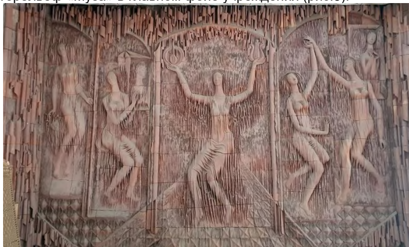
Рисунок 3 – Горельеф «Муза» в фойе Государственного учреждения комплекс «Кохи Борбад», 1983-1984 годы.