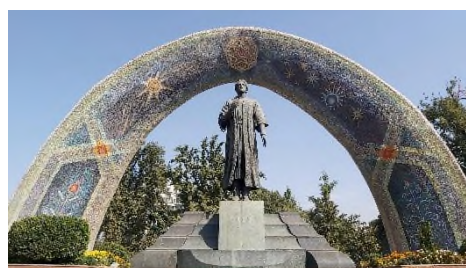
Рисунок 2 – А) Мозаичные панно на фасаде Алюминиевого завода города Турсунзаде «Укрощение огня» 1999 г., Б) Памятник Абуабдулло Рудаки в г. Душанбе, 2008 г.