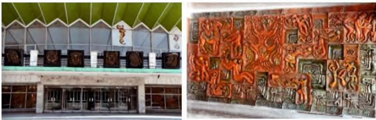
Рисунок 4 – А) Керамические горельефы «Маски клоунов», ковка по меди на фасаде здания Госцирка, Б) Керамический горельеф «Мир цирка» у интерьера Госцирка в г. Душанбе, 1976 г.